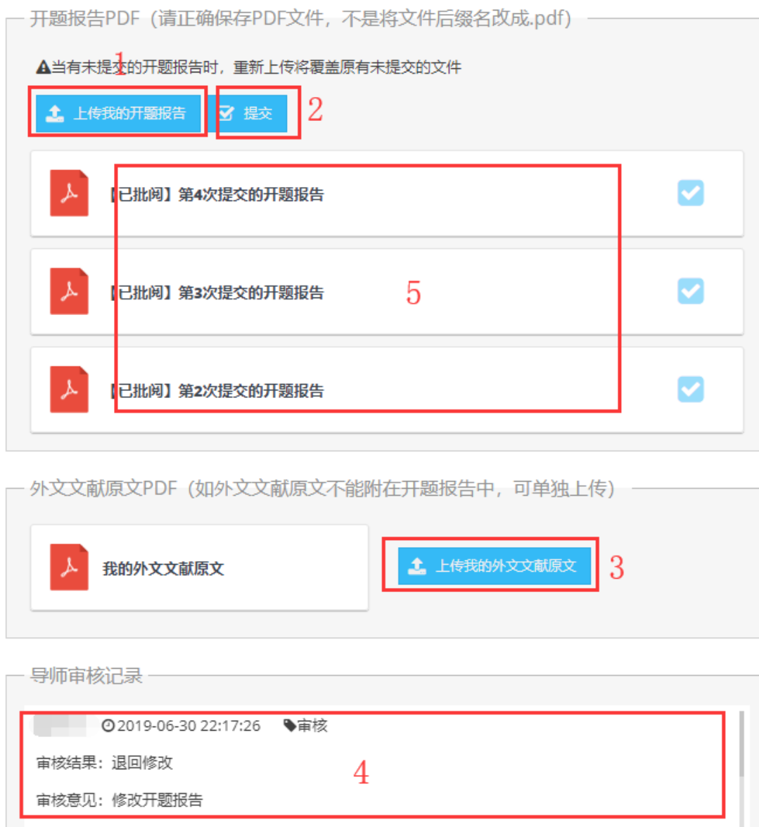
图 4.3 上传开题报告