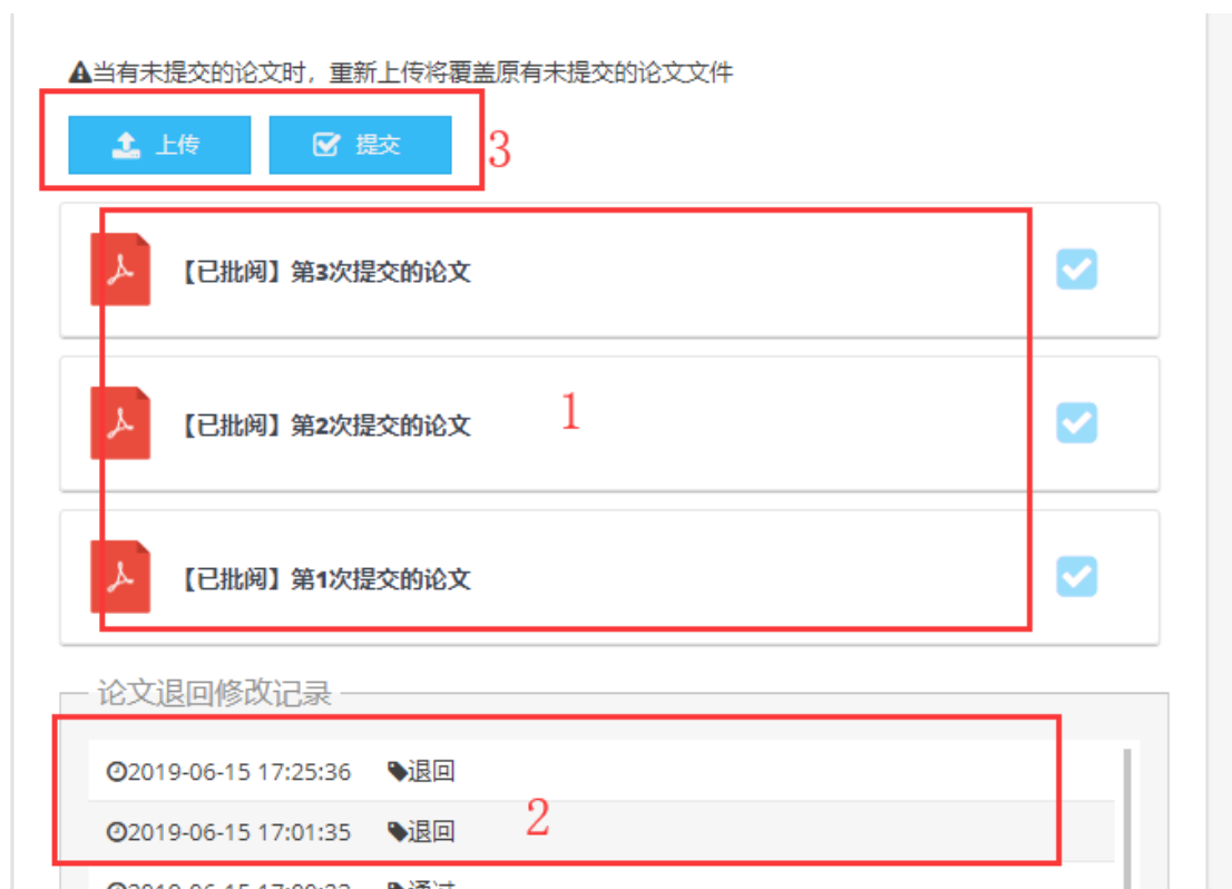
图 4.4 上传论文